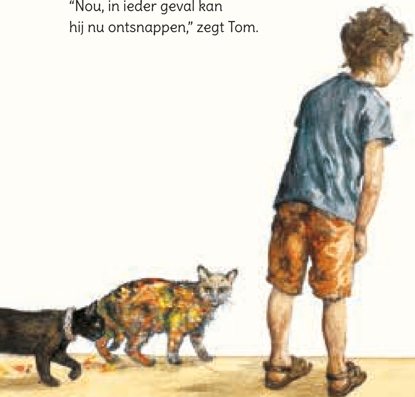
PIET (Zwart-witte koekat) Eenvoudig en rechtdoorzee. Hi werd gevonden in een garage waar hi was achtergelaten in een kartonnen doos.